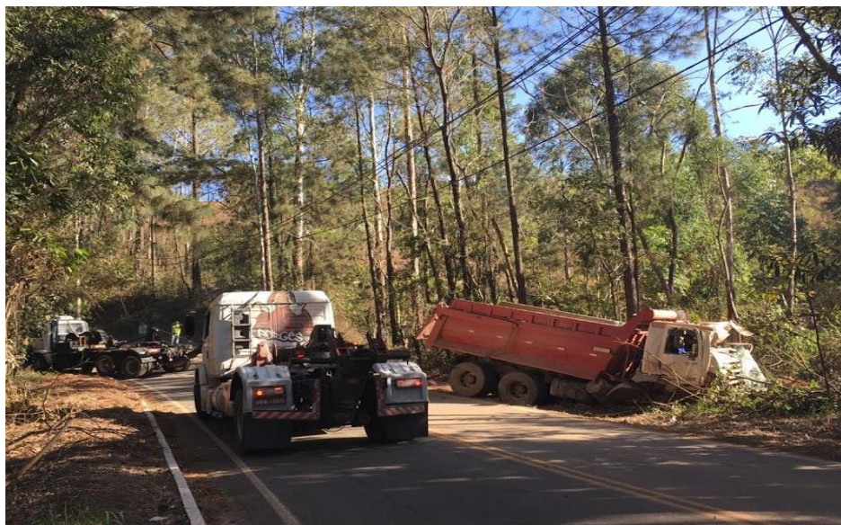
Registro dos dois acidentes.