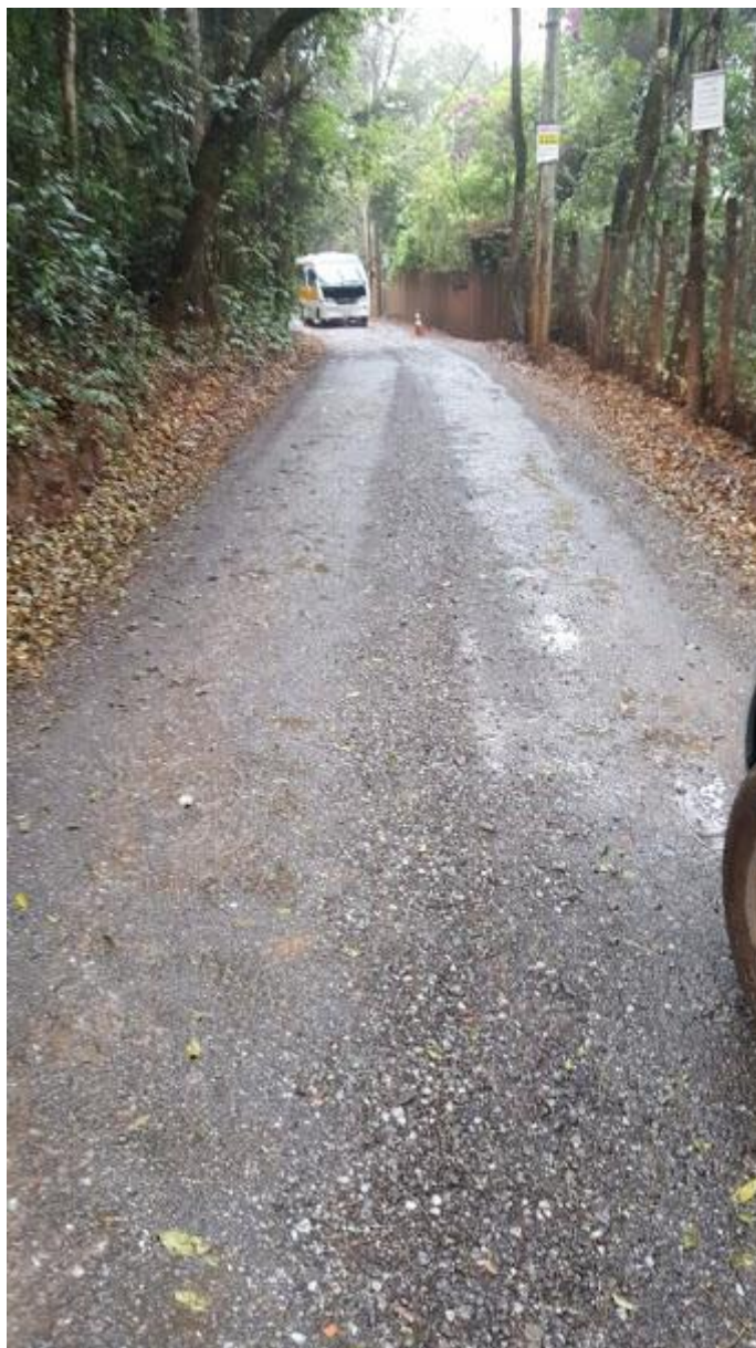
Estrada Parque do Engenho: